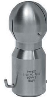
S40 -360° clip on